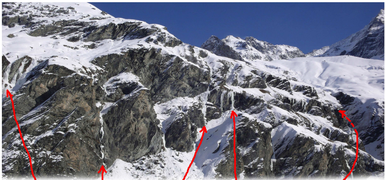
Le grand bleu Les bêtes qui s'ignorent Cascade des Sétives Sassoulka Alexia Cascades de la gorge 1 et 2